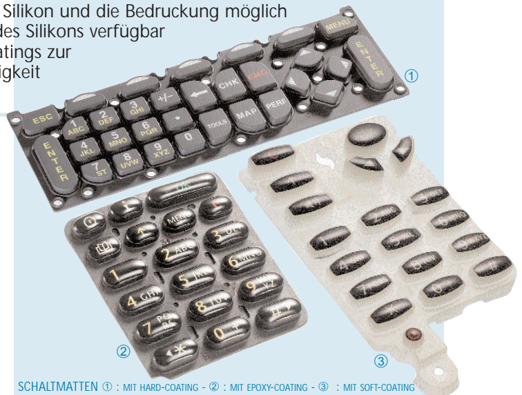
SCHALTMATTEN ① : MIT HARD-COATING - ② : MIT EPOXY-COATING - ③ : MIT SOFT-COATING